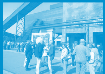
Exkursion 2010: Ruhr Museum, Essen

Anmeldung: Tel. 0 22 02 / 8 42 47; E-Mail: info@das-schulmuseum.de