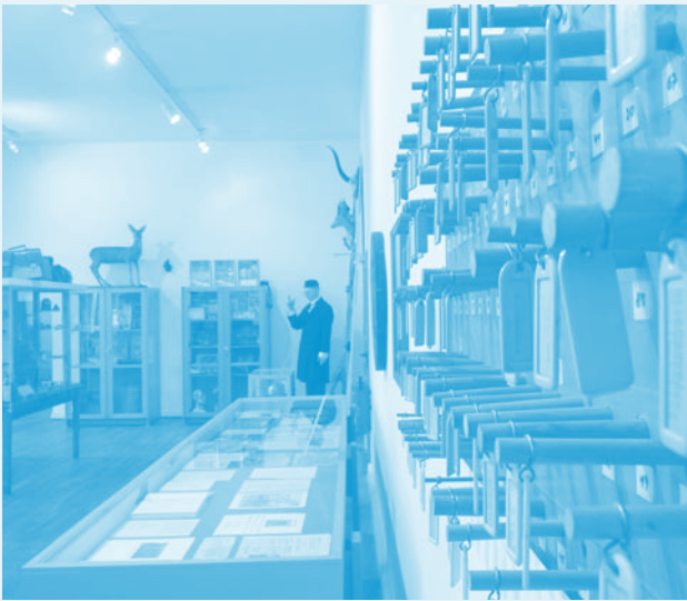
Sonderausstellung „Goldhähnchen und Unkepuz“